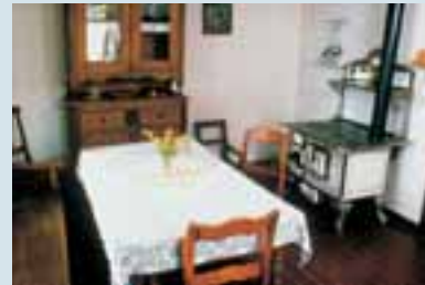
Historisch eingerichtetes Bauernhaus

Historische Kalkbrennerei mit alten Öfen und Werkhäusern, heute Ausstellungen zur Geologie, Mineraliensammlung und alte Getreidemühle