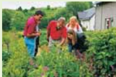
Bauerngarten am Naturschutzzentrum

Historische Kalkbrennerei mit alten Öfen und Werkhäusern, heute Ausstellungen zur Geologie, Mineraliensammlung und alte Getreidemühle