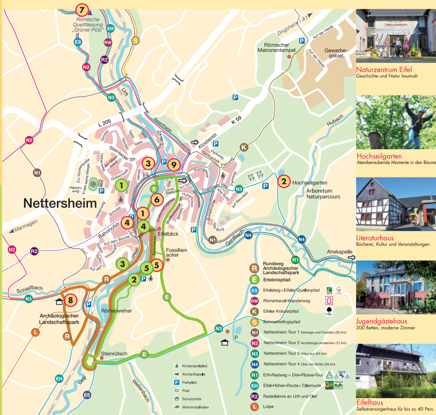
Naturzentrum Eifel Geschichte und Natur hautnah

Der Weg führt durch das idyllische Urftal mit seiner naturbelassenen Auenlandschaft und über Höhenzüge mit weitem Fernblick. Die Wanderzeit für die Wegstrecke von 5 km hängt ganz von der Verweildauer an den Stationen ab. Tipp: Fallblatt mit Karte und Hinweisen zu den Stationen sowie Spiel- und Aktionstipps als hilfreicher Wegweiser an der Tourist-Information für 0,50 €